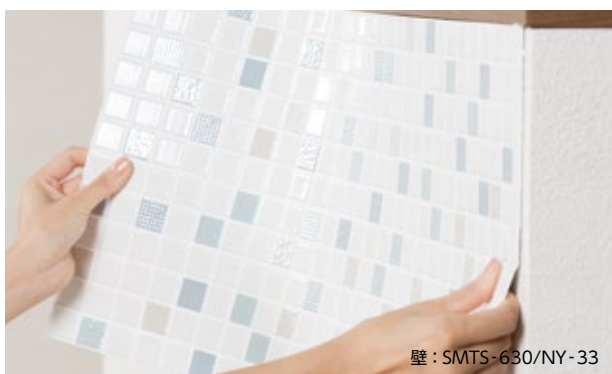
壁 : SMTS-630/NY-33

切断・張付けが容易で目地詰めも必要ない、新感覚のモザイクシート。 簡単な施工でモザイクタイルのアクセント張りが気軽に楽しめます。